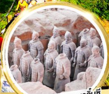
กองทัพทหารดินเผาจีนซี