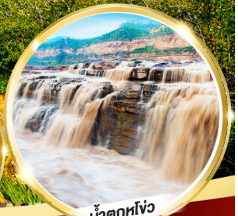
น้ำตกหูโง่