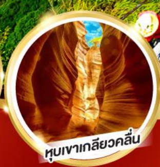
หุบเงาเกลียวคลื่น