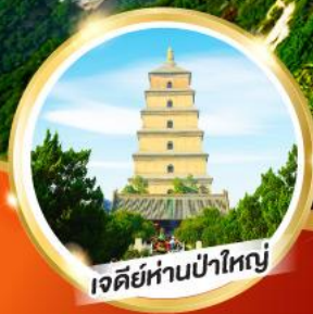
เจดีย์ห่านป่าใหญ่